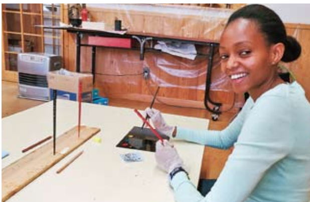
「安比塗漆器工房」にて 絵付け体験

「岩鑄鉄器館」では、たくさん並んだ見事な鉄茶瓶のディスプレイにはもちろん、職人の皆さんがすべての製造過程においてひとつひとつ正確に手作りされていることに、感銘を受けました。お店には世界最大の350kgにもなる鉄瓶もありました。