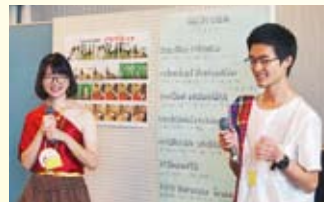
タイ語でドラえもんの歌合唱

多くの親子が参加し、アメリカ、タイ、ケニア、ナイジェリア出身の方々がそれぞれの国の文化を紹介したり、絵本の読み聞かせ、歌やダンス、ゲームをして一緒に楽しみました。