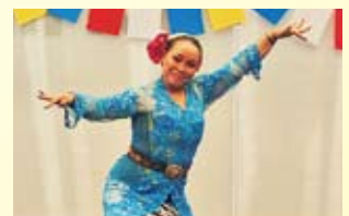
ワールドステージ「ジャワ舞踊」